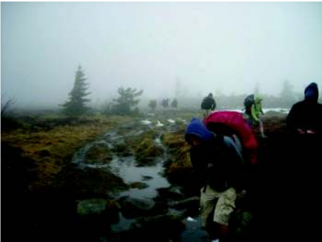
Illustration 21: Tsjoolen door mist en harde wind

Rond 10 uur hebben we dan toch het hutje wat opgeruimd en zijn we vertrokken richting le Lac Blanc. We dalen wat en komen onder de wolken terecht zodat we toch nog een mooi zicht hebben op het meer. Dit moet prachtig zijn bij mooi weer. Er