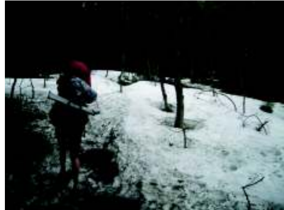
Illustration 13: Sneeuw sneeuw sneeuw ...

Bij het afdalen van de berg verslechtert het weer, het begint te sneeuwen, waaien en motregen. Het pad ligt langs de noordkant van de berg en er ligt dus nog heel veel sneeuw. Blijkbaar loopt het pad hier tussen grote rotsblokken maar alles is ondergesneeuwt. Hier ligt minstens twee meter sneeuw. Zolang we op de rotsblokken lopen valt het nog mee, maar regelmatig zetten we een verkeerde stap en schieten we tot onze heupen in de sneeuw tussen twee rotsblokken door. Eigenlijk is dit veel te gevaarlijk maar we kunnen niet anders dan doorgaan. Héél voorzichtig en met heel veel moeite bereiken we tenslotte de andere kant van de berg. Ondertussen is het weer er niet op verbeterd, we zijn allemaal nat en hebben koud.