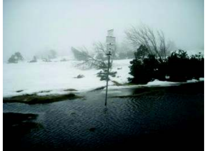
Illustration 20: Het wijzerbordje op Gazon du Faing staat in het midden van een vijvertje ...

zweeft een helikopter stationair boven het water. Het lijkt wel een reddingshelikopter. We klimmen weer omhoog, richting wolken. Dit zou eigenlijk één van de mooiste stukjes van onze tocht moeten zijn. We wandelen een hele tijd over een bergrug (Gazon du Faing en Gazon de Faïte: 1302m), een vlak stuk grasland met weinige struiken met aan iedere kant steile kliffen. Het uitzicht moet prachtig zijn, ..., alleen jammer van de dichte mist, de harde wind en de occasionele motregen, ... Ik loop voorop en iedere tien minuten stop ik om te controleren of ze nog alle zeven achter mij zie. We wandelen bijna twee uren over dit stuk. Eenmaal we beginnen te dalen hebben we minder last van de wind en de mist maar is het pad volledig verdwenen onder meters sneeuw. We volgen de paaltjes die het pad afbakenen (dat denken we tenminste) en de voetsporen van mensen die ons voor geweest zijn, blijkbaar zijn we niet de enige zotten.