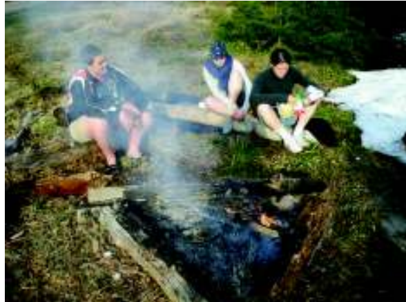
Illustration 8: Koken