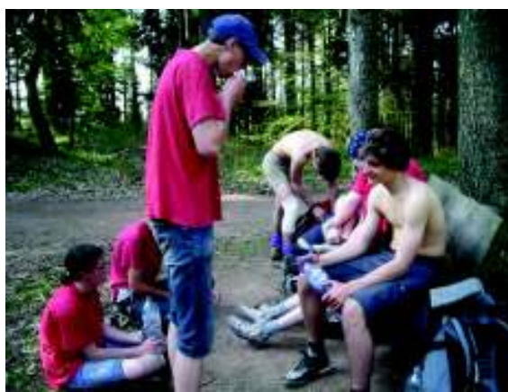
Illustration 5: Eventjes rusten

De eerste echte wandeldag! Omstreeks 07.00 staan we op om de tenten af te breken en te vertrekken. We zitten nu op 265m en we moeten naar 1206m. Veel werk voor de boeg dus. Rond kwart na acht vertrekken we richting Aubure. Onderweg komen we de ruïnes van Bilstein (673m) op de Col du Seelacker tegen en de Rocher du Koenigsstuhl op 938m. Tegen de middag komen we aan in het dorpje Aubure op 800m. De enige winkel in het dorp blijkt voor drie dagen gesloten te zijn wegens werken. De volgende winkel bevindt zich op minstens tien uren wandelen ... Die middag eten we dan maar eens niet. We hebben wel één brood kunnen kopen in een herberg (dat we bewaren voor het ontbijt van morgenochtend). Er is wel een frisse bron om onze waterflessen te vullen.