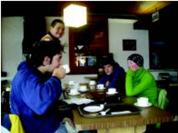
Illustration 24: Gezellig koffie drinken

Tegen 12 uur komen we aan op Roche du Tanet (1293m) en eten we ons middagmaal. We dalen verder af tot in Col de la Schlucht (1139m). Daar aangekomen blijken er een aantal hotels/café's/restaurants te zijn en zelfs een souvenirwinkel! Waarschijnlijk voor de nabijgelegen kabellift. Normaal zouden we nog drie uren verder moeten wandelen tot in Metzeral om daar de volgende dag de trein te nemen naar Straatsburg, maar wegens de vertraging door het slechte weer (en het slechte weer zelf) besluiten we om hier op de bus te wachten die ons naar Colmar zal brengen. Morgen kunnen we dan van daar met de trein naar Straatsburg. Om wat op te warmen gaan we iets gaan drinken (warme koffie en chocomelk met slagroom!!!) en daarna vragen we wat inlichtingen over de bus. Om hem zeker niet te missen staan we al ruim een half uur op voorhand langs beide kanten van de weg te wachten :-)