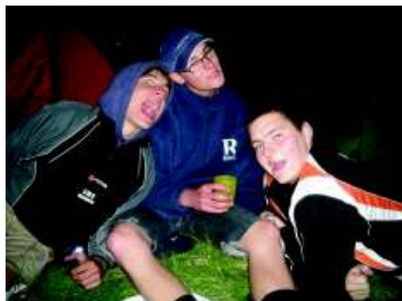
Illustration 27: PJ, Carlu & Berre