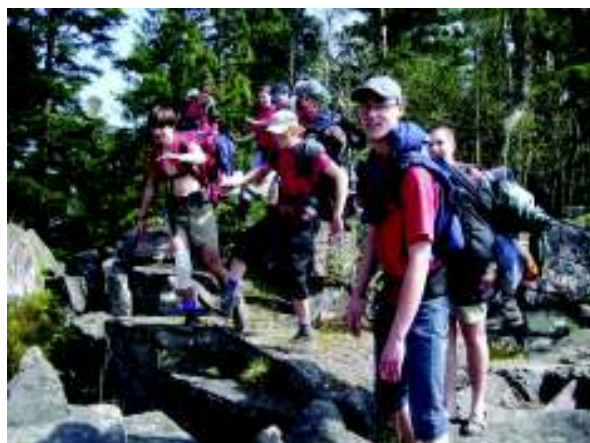
Illustration 6: Op de Roches du Tetras

De eerste echte wandeldag! Omstreeks 07.00 staan we op om de tenten af te breken en te vertrekken. We zitten nu op 265m en we moeten naar 1206m. Veel werk voor de boeg dus. Rond kwart na acht vertrekken we richting Aubure. Onderweg komen we de ruïnes van Bilstein (673m) op de Col du Seelacker tegen en de Rocher du Koenigsstuhl op 938m. Tegen de middag komen we aan in het dorpje Aubure op 800m. De enige winkel in het dorp blijkt voor drie dagen gesloten te zijn wegens werken. De volgende winkel bevindt zich op minstens tien uren wandelen ... Die middag eten we dan maar eens niet. We hebben wel één brood kunnen kopen in een herberg (dat we bewaren voor het ontbijt van morgenochtend). Er is wel een frisse bron om onze waterflessen te vullen.