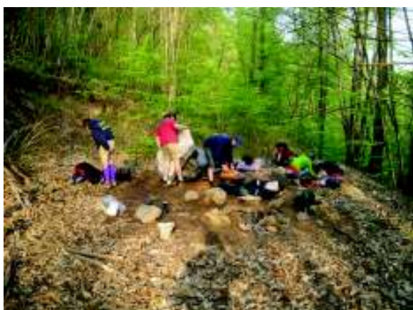
Illustration 4: Kampplaats opruimen