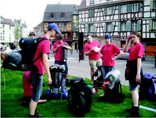
Illustration 2: Eventjes rusten in Colmar