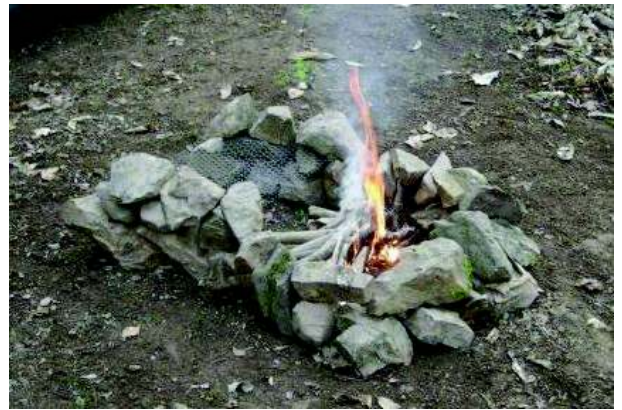
Illustration 3: Kampvuur met rooster om te koken

Daar aangekomen moesten we dan nog de trein nemen naar Colmar om van daar met de bus naar Ribeauvillé te rijden (hier beginnen de bergen al!). Tegen 18.11 zijn we daar toegekomen. Na een kleine wandeling (en de eerste blinnen bij Carlu) hebben we een kampplaats gevonden om te overnachten. Na het opzetten van de tenten en het aanmaken van het kampvuur hebben we lekkere barbecue gegeten. Niets is leuker dan vlees verkoken op en zelfgemaakt vuur!