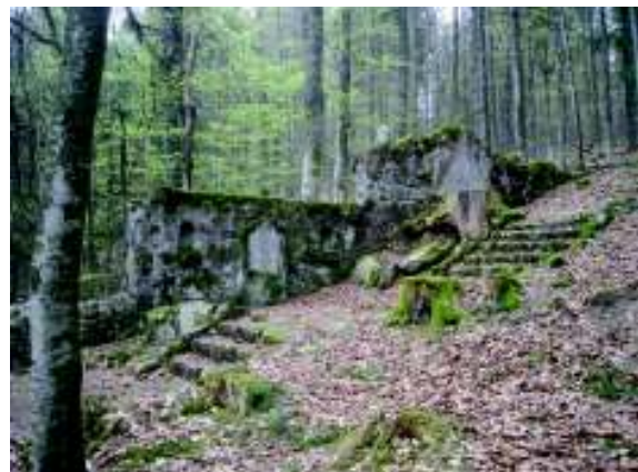
Illustration 10: Restanten van een Duits militair kerkhof

Dit is een prachtig meer, omgeven door steile bergwanden. We komen versterkingen tegen van de Duitsers uit de Eerste Wereldoorlog. Van daar blijven we klimmen naar Roche du Corbeau (1130m) en ten slotte Tête des Faux (1220m), waar we een