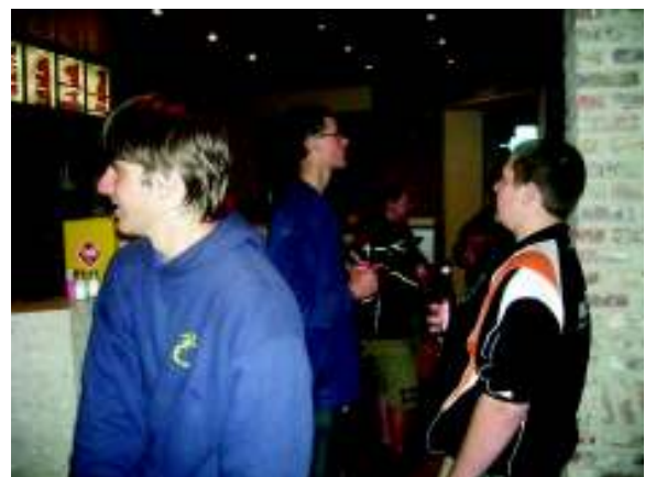
Illustration 30: Frituur Sint Joris, wat zouden wij zonder jou beginnen?