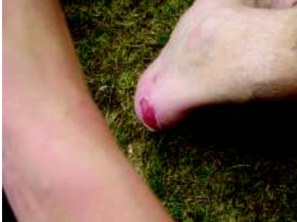
Illustration 12: Carlu's blinnen

prachtig uitzicht hebben op het vlakke land ten westen van de Vogezen en een andere bergketen in de verte. Onderweg zijn opnieuw heel wat sneeuw tegengekomen, we zakken soms al tot onze knieën in de sneeuw! Carlu laat zijn blinnen voor de eerste keer verzorgen, hij heeft al bijna geen vel meer aan zijn hielen. Berre tsjoolt verder op zijn sleffers, zijn voeten doen in gewone schoenen te veel zeer door de blinnen.