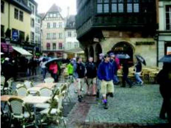
Illustration 29: Straatsburg bezoeken

Geen tijd om uit te slapen, we moeten onze trein halen! Tegen 9u vertrekken we in de richting van het centrum van Colmar. Rond 10u nemen we de trein naar Straatsburg. Daar aangekomen bezichtigen we de stad. Ook al wil niemand het geloven, Straatsburg is echt een mooie stad. Wegens het slechte weer is een stadsbezoek toch