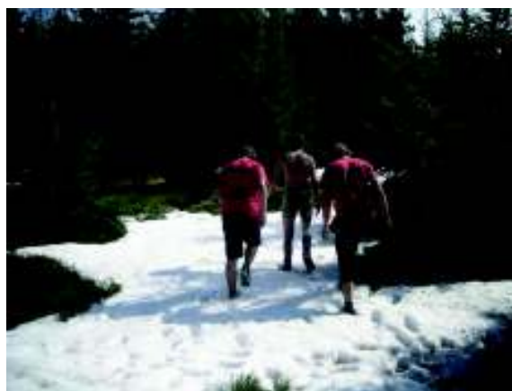
Illustration 7: De eerste sneeuw!

Tegen 14u vertrekken we opnieuw richting Le Bonhomme. Op le champ du Diable (Duivelsveld) komen we die dag ook onze eerste sneeuw tegen! Voorlopig vinden we dit nog wel leuk, ..., voorlopig. Tegen 17u slaan we onze tenten op op de top van een berg, le Petit Brézouard (1206m) hoogte. Die avond eten we ons noodrantsoen (zakjes pasta à la Provençale) naast een gezellig kampvuur.