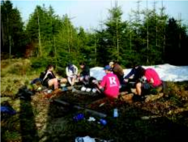
Illustration 9: Gezellig rond het kampvuur