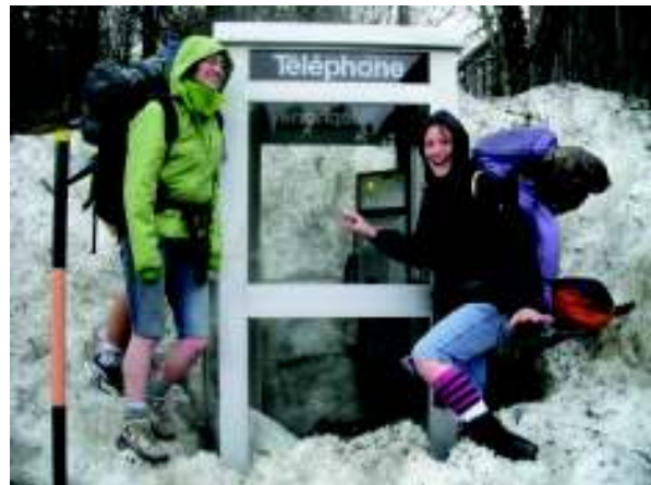
Illustration 25: J&J proberen het telefoonhokje open te krijgen

In Colmar aangekomen zorgen we voor wat voorraad (we komen nog net op tijd toe in de Monoprix) en zoeken we een plaats ergens buiten de stad om onze tenten op te zetten. Onderweg komen we nog twee mooi meiden tegen die uit Australië blijken te komen. Ze laten ons weten in welke jeugdherberg ze logeren en in welke kamer we moeten zijn. Blijkt dit wel niet al te ver van onze campeerplaats te zijn zeker!