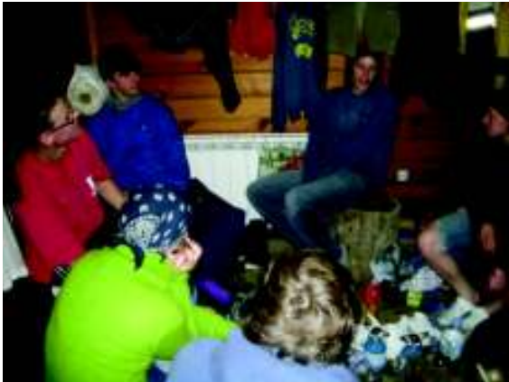
Illustration 17: In het blokhutje

macaroni met worstjes, kalkoen, Napolitaanse saus, tomaat en provençaalse kruiden. 's Avond slapen we allemaal samen in het hutje terwijl buiten het slechte weer blijft voortduren en Blomme en PJ een stuute willen smèren.