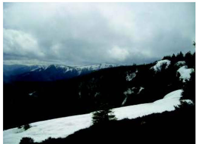
Illustration 23: Uitzicht bij het afdalen