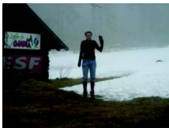
Illustration 19: Jessyyyyyyyyyyyyyyyyyyyyyy!