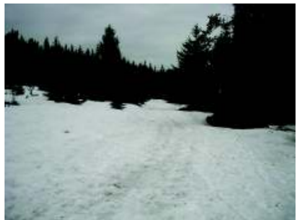
Illustration 14: Het pad is ondergesneeuwt

We besluiten om uit te kijken naar een schuilplaats voor de nacht. Na een uurtje komen we op de Col du Calvaire de Lac Blanc (1144m). Er is hier een ski-piste, maar in deze tijd van het jaar is die niet open. Er is een herberg of twee maar die zijn niet open. De tenten op zetten in dit weer belooft een huzarenstukje te worden, daarbij komt nog dat iedereen het echt ijskoud heeft. We vinden echter een klein blokhuutje dat blijkbaar gebruikt wordt om wat ski-materiaal te bewaren. Het is op slot, maar ik zet mijn schouder tegen de deur en voor we het weten zijn we binnen. Daar leggen we de elektriciteit aan zodat we ons wat kunnen warmen aan het elektrisch vuur (!). Buiten wordt het langzaam donker. Het blijft waaien en sneeuwen. Die avond eten we