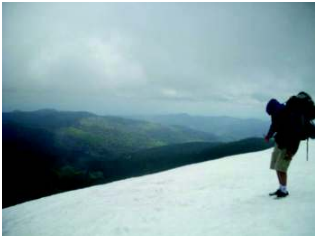
Illustration 22: Eenmaal onder wolken is het uitzicht wel prachtig

zweeft een helikopter stationair boven het water. Het lijkt wel een reddingshelikopter. We klimmen weer omhoog, richting wolken. Dit zou eigenlijk één van de mooiste stukjes van onze tocht moeten zijn. We wandelen een hele tijd over een bergrug (Gazon du Faing en Gazon de Faïte: 1302m), een vlak stuk grasland met weinige struiken met aan iedere kant steile kliffen. Het uitzicht moet prachtig zijn, ..., alleen jammer van de dichte mist, de harde wind en de occasionele motregen, ... Ik loop voorop en iedere tien minuten stop ik om te controleren of ze nog alle zeven achter mij zie. We wandelen bijna twee uren over dit stuk. Eenmaal we beginnen te dalen hebben we minder last van de wind en de mist maar is het pad volledig verdwenen onder meters sneeuw. We volgen de paaltjes die het pad afbakenen (dat denken we tenminste) en de voetsporen van mensen die ons voor geweest zijn, blijkbaar zijn we niet de enige zotten.