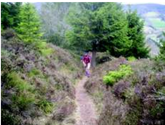
Illustration 11: Een serieuze klim

Om 7u staan we op en breken we de tenten af. We nemen die ochtend een shortcut via de GR532 rechtstreeks naar het dorpje Le Bonhomme. Dit ligt op 690m, weer een heel stuk afdalen dus. Daar hebben we inkopen gedaan om dan verder te gaan via een serieuze klim tot aan l'Etang du Devin op 950m waar we ons middagmaal nuttigen.